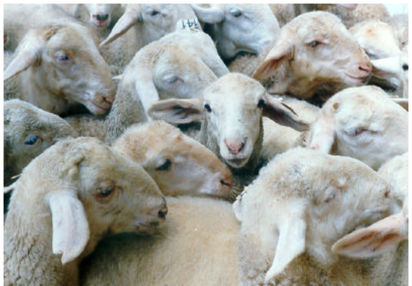
Foto 1: Corderos Manchegos del núcleo de ovino del ITAP (Las Tiesas).

A lo largo de los últimos años, el número de corderos destinados para vida , que incluye tanto los destinados a la reposición en otros rebaños, como los corderos que ingresan en el Esquema de Selección para su testaje, ha aumentado en más de un 100% desde el año 1992 (Tabla 4) .